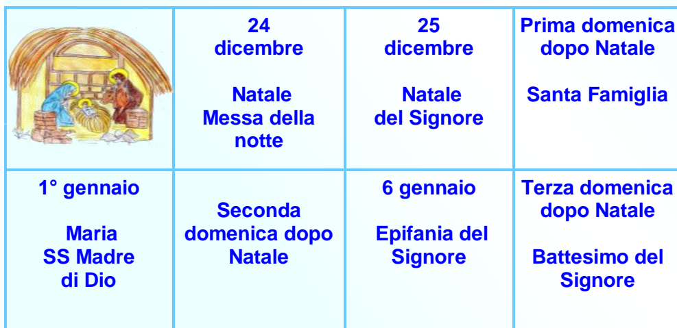
Tabella riassuntiva del tempo di Natale.