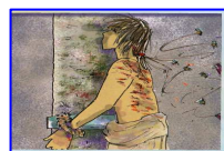
La flagellazione di Gesù