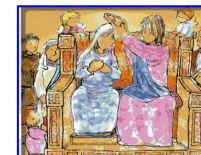
L'Incoronazione di Maria regina del cielo e della terra