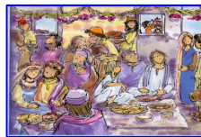
Le nozze di Cana