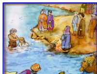
Il battesimo di Gesù al Giordano