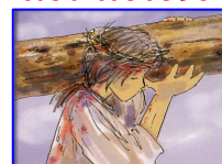
Salita al Calvario