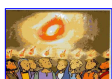
La discesa dello Spirito Santo