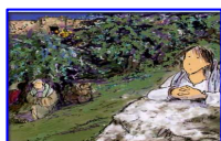
Gesù nell'orto degli ulivi