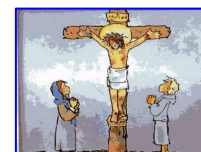
La morte di Gesù