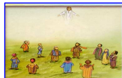
L'ascensione di Gesù al cielo