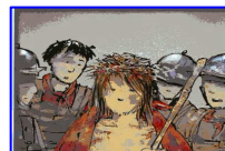
La corona di spine