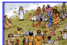
Annuncio del Regno