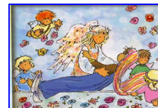
L'Assunzione di Maria al cielo