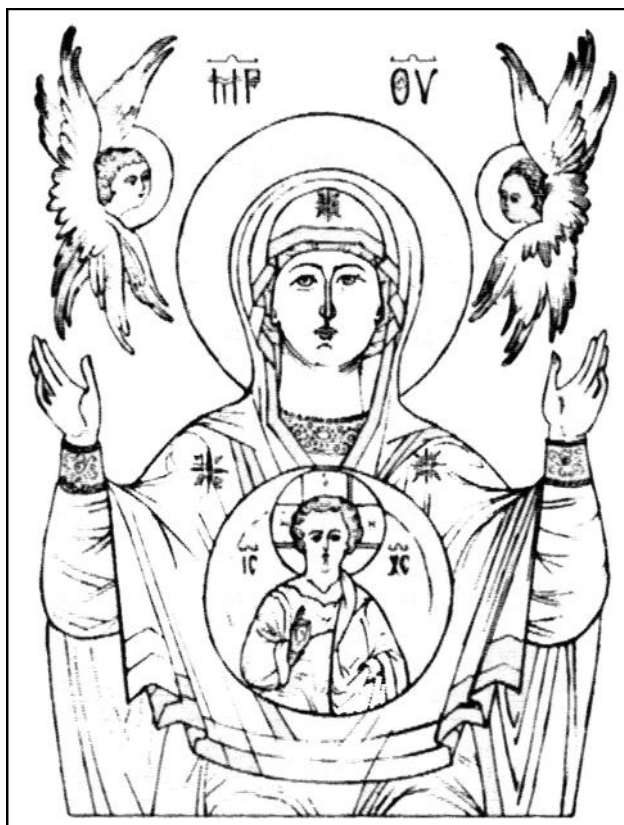
La Vergine del Segno