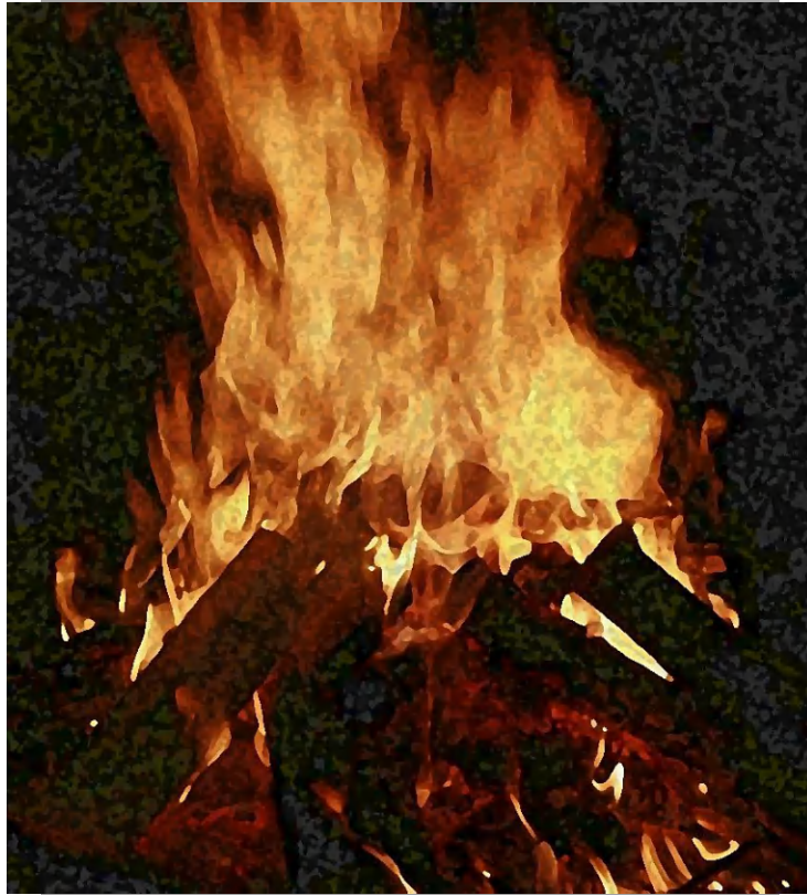
Benedizione del fuoco