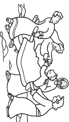
...alla vedova di Nain