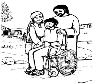
L'UNZIONE DEGLI INFERMI